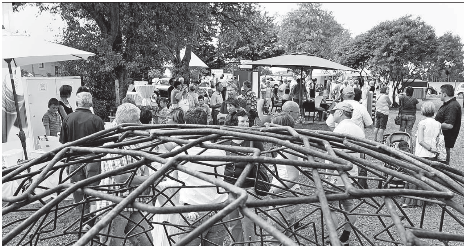
Beim 50-jährigen Jubiläum der Firma Briel sind die unterschiedlichsten handwerklichen Kreationen ausgestellt worden. Dank des guten Wetters am Wochenende ist die Ausstellung gut besucht gewesen.

Der glitzernde Kronleuchter aus Edelstahlbändern zeigte sich als Überraschung unterm Hollerbusch. Zwischen zwei Bäumen hing ein Spiegel, darunter ein eckiger Waschtisch mit passendem Becken. Riesige Kugeln aus Armierungsstahl schienen über dem grünen Untergrund zu schweben. Durchdachte Konzepte für Außenküchen, Grillstationen und dem Wohnen im Freien komplettierten die Wünsche von Freizeitbegeisterten.