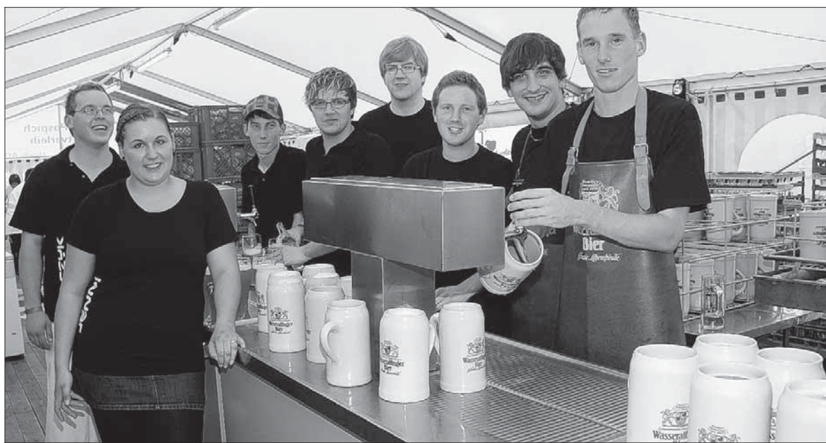
Am Zapfhahn macht das Bedienen doch gleich doppelt Spaß: Die Mitglieder der Pfahlheimer Hütten KTP und RHP haben zum ersten Mal als Gruppe den Getränkeausschank beim Seefest während der Ausgabe des Mittagessens übernommen.

Seit Beginn des Seefestes begeistert die Trachtenkapelle Pfahlheim